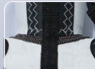
3D KEVLAR AIRFRAME