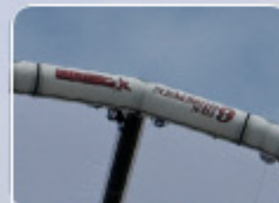
CUBEN EQUIPPED LE