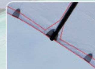
CANOPY FRAMING TECHNOLOGY